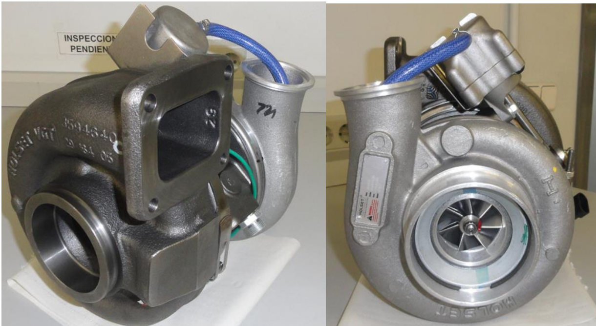
JUNTA PARA EL MONTAJE DEL COMPRESOR IVECO 98451118