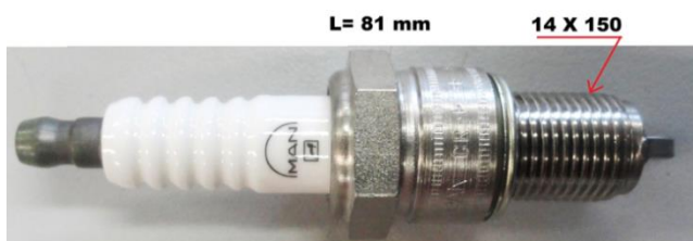
GE5-1 DENSO JAPAN CR